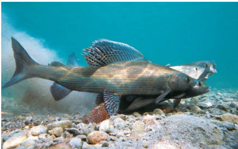
Die Äsche gehört auch zu den bedrohten Fischarten.

lich reizvollen Flussufer mit ihren Kiesbänken, Sandbuchten, Abbrüchen und urigen Gehölzen. An den künstlichen Böschungen der Stauhaltungen kann eine typische Flussufervegetation nicht entstehen.