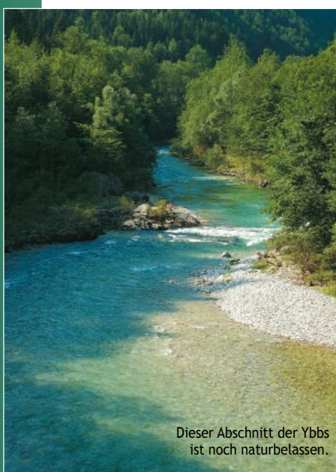
Dieser Abschnitt der Ybbs ist noch naturbelassen.